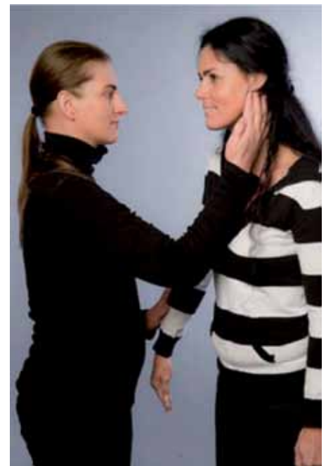
1 Testpunkte für Fremdenergien in der Kuhle hinterm Ohrfläppchen (li + re)

Der folgende Fahrplan mit seinen verschiedenen Varianten hat sich inzwischen seit Jahren bei mir und meinen vielen Hundert Kinesiologie-Schülern bewährt. Wir fanden zwei Testpunkte für „Fremdenergien“ heraus: links und rechts in der Kuhle direkt hinter dem Ohrfläppchen. Werden Zeige- und Mittelfinger in diese Vertiefung gelegt und der Indikatormuskel schaltet ab, können wir davon ausgehen, dass eine Fremdenergie vorliegt. Oft zeigt sich in der Kuhle rechts ein männlicher und in der Kuhle links ein weiblicher Einfluss – wir testen in jedem Fall auf beiden Seiten.